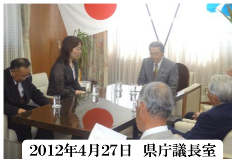
2012年4月27日 県庁議長室