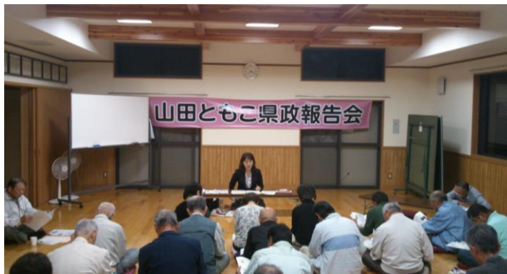
2012年10月6日 栗迎4区集会所で県政報告会を開催

● 世知原町は、周辺地域に比べて過疎化が進んでおり、高齢化率も33%と県平均の25%を大きく上回るなど、大変厳しい状況にある。このトンネルは、住民の安全・安心と地域振興のために、大変重要な事業である。しかし、現時点において、県としての具体的な検討は行われていない。さまざまな事業の中で、どの事業を優先するかということは、道路整備という分野だけをとっても、渋滞対策や事故対策、緊急車両通行の問題、産業振興などなど、さまざまな視点が考え