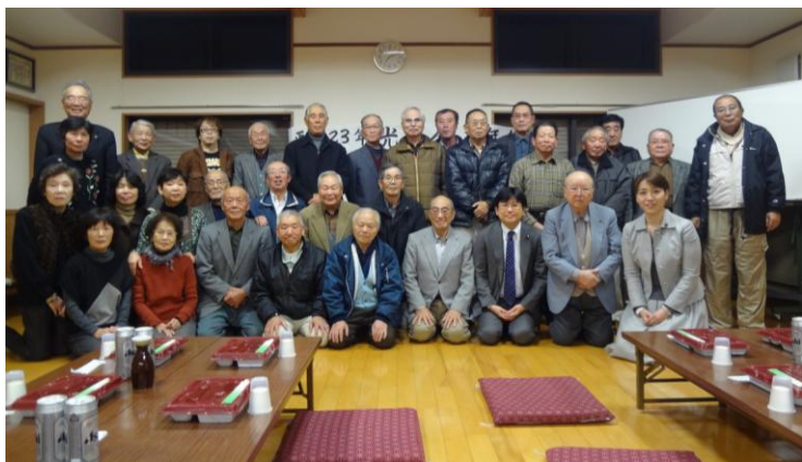
2011年12月10日 毎年恒例の世知原・光葉会にて

● 公共事業に限らず、すべての分野においてハード、ソフトを問わず、県政の推進のためには市町との連携を今まで以上に図っていくことが重要である。そのため、各部局において、地元市町の現状を把握し、要望内容を十分にお聞きした上で、各事業等の必要性や重要度を判断していきたい。なお、広域的な課題であれば、必要に応じて、市長会、町村会と新たに設置する協議の場も活用していく。