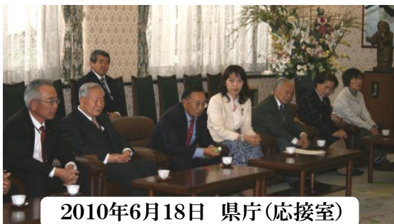
2010年6月18日 県庁(応接室)