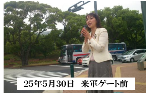
25年5月30日 米軍ゲート前