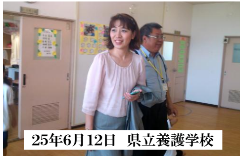
25年6月12日 県立養護学校