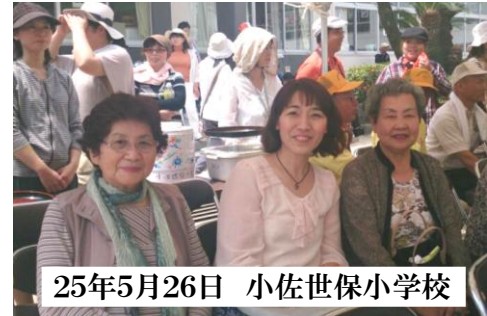
25年5月26日 小佐世保小学校