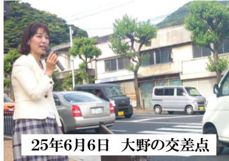
25年6月6日 大野の交差点

●地域の皆様に県議会での論点や私の主張する政策、日々の活動などをご報告するため、街頭報告を行っています。