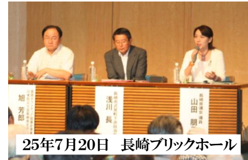
25年7月20日 長崎ブリックホール