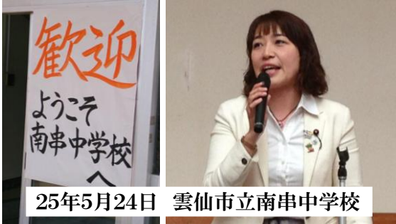
25年5月24日 雲仙市立南串中学校