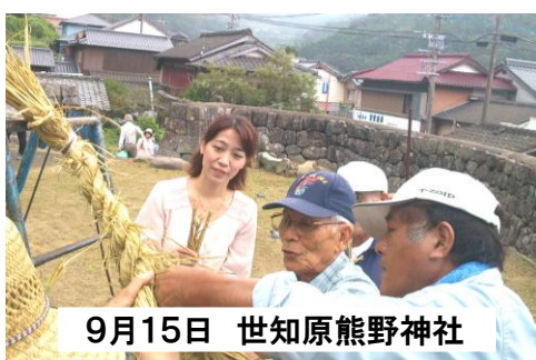
9月15日 世知原熊野神社