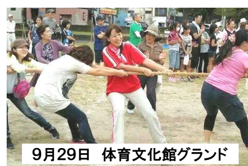
9月29日 体育文化館グランド