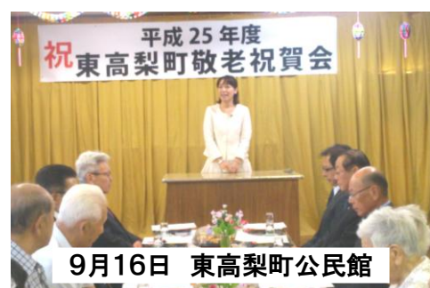
9月16日 東高梨町公民館