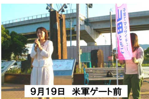
9月19日 米軍ゲート前