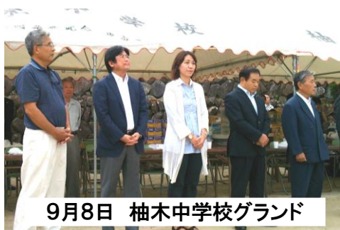
9月8日 柚木中学校グランド