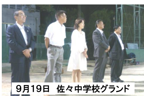
9月19日 佐々中学校グランド