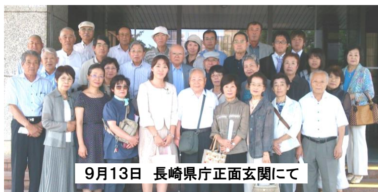
9月13日 長崎県庁正面玄関にて

●一般質問当日、地元より多くの皆さんが県議会の傍聴に来てくださいました。ご期待に沿えるよう頑張ります。