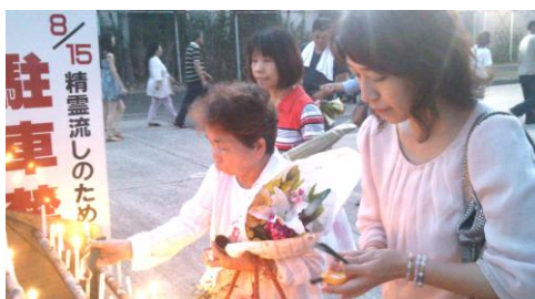
8月15日 佐世保高専グランド横